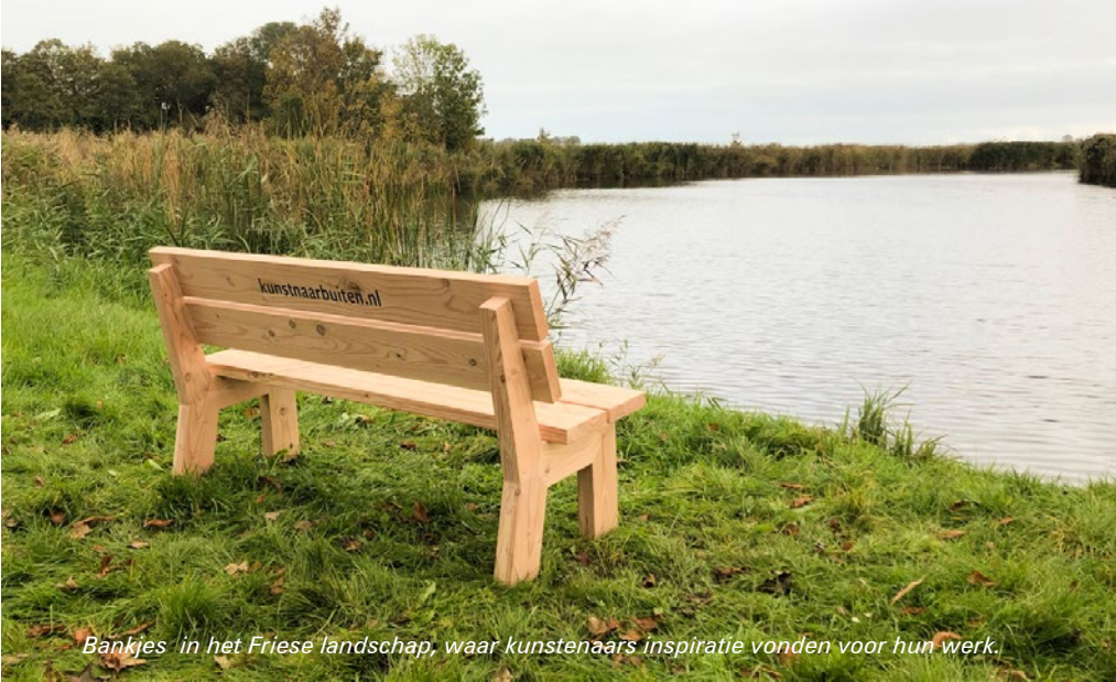
Bankjes in het Friese landschap, waar kunstenaars inspiratie vonden voor hun werk.

'Aandacht is de zeldzaamste en zuiverste vorm van vrijgevigheid'. Een uitspraak van de filosofe Simone Weil (1909-1943). Aandacht die we blijven geven, ook nu het Covid-19 virus onder ons is.